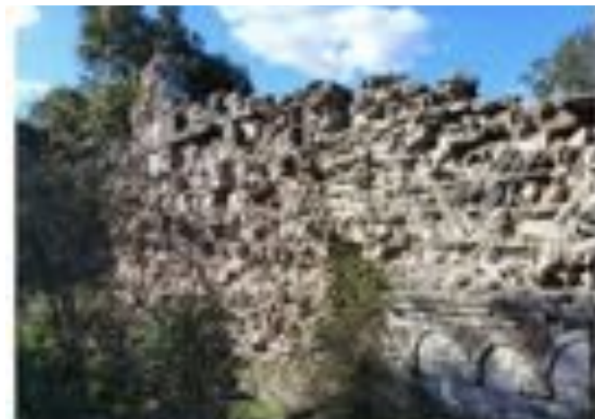
le mur intérieur nord a perdu ses beaux pavements de granit, dalles arrachées et certainement récupérées.

« Pasqua à u balcone, Natale à u fucone »