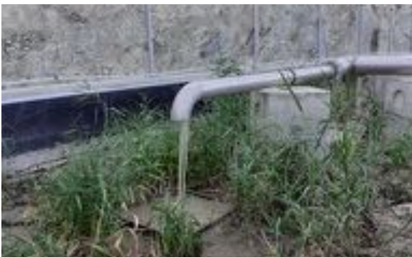
L'eau s'écoule d'un bassin à un autre

Que deviennent les eaux usées une fois qu'elles ont été filtrées ? La qualité est-elle sûre ? Y-a-t'il un risque de pollution ? Il y a trois bacs d'épuration qui permettent 3 degrés d'épuration. Le système est mécanique, nous n'utilisons pas d'électricité, c'est écologique. Une première filtration, le dégrilleur, alimenté par panneaux solaire. La deuxième filtration correspond au premier bassin divisé en trois, avec les gros gravier. La troisième filtration correspond au deuxième bassin divisé en deux avec petit gravier et sable. Il y a un flotteur qui capte le degré de remplissage du bac et envoie automatiquement les eaux dans le deuxième bac quand c'est nécessaire. Et ainsi de suite. Donc pour reprendre, dans le premier bac il y a du gravier très gros qui va assurer une première filtration, dans le deuxième bac, du gravier un peu moins gros et du sable qui vont assurer une deuxième filtration et retenir ainsi les impuretés qui seraient passées à travers la première filtration. Quand c'est plein, par débordement, une chasse se met en route et l'eau passe dans le deuxième bac, puis dans le troisième. Les eaux usées filtrées sont déversées en fin de course, en sortie de station, en bas, dans le ruisseau qui borde la station. L'eau est quasi pure, il n'y a plus aucun déchet dedans. L'Agence de l'eau effectue un relevé annuel de cette eau et valide ou pas la qualité et la quantité d'eau qui est déversée dans le ruisseau.