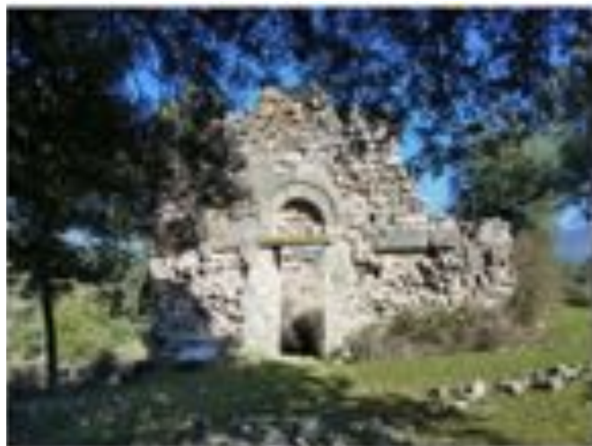
La Tribuna, édifice pievéno de la Chiesa di S. Maria, abitato nei secoli Germasini et Portofino (segola nuova)

Le site de la Pieve ressemble à celui d'une petite bourgade romaine. C'est une sorte de plateau fertile placé entre deux petits cours d'eau où l'on peut ramasser de nombreuses briques et tuiles à crochets d'époque romaine et corso-romaine.