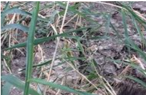
Croûte formée par les déchets

C'est le roseau qui joue le rôle de filtre ? Pas du tout. Le roseau est là pour casser la croûte résiduelle de déchets qui se forme à la suite des filtration successives. Cette croûte peut-être très épaisse. Il faut éviter un agglomérat afin que l'eau puisse s'infiltrer continuellement. Le roseau est en mouvement perpétuel. Le mouvement des roseaux va empêcher le compactage de cette croûte. Les racines auront le même rôle, mais sous la couche superficielle de cette croûte. Le rôle de filtre est assuré par les graviers, le sable, la terre.