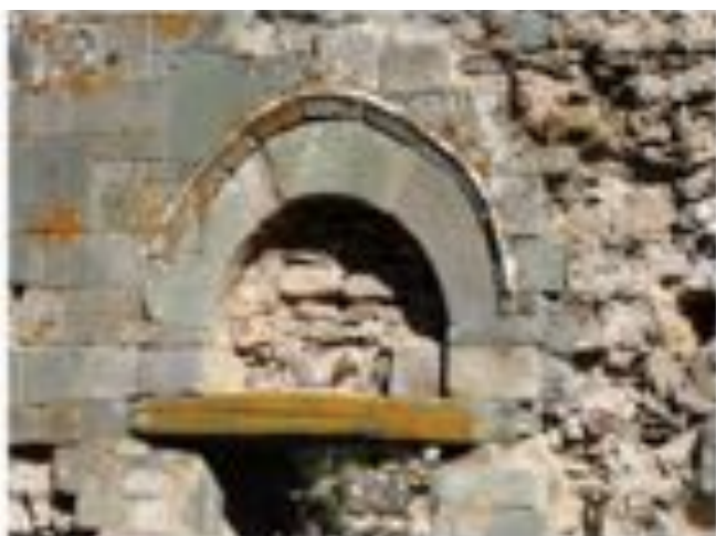
le linteau de la porte occidentale, un motif de schéma: sert, semble-t-il, un mur à l'est et à l'ouest.

« Pasqua à u balcone, Natale à u fucone »