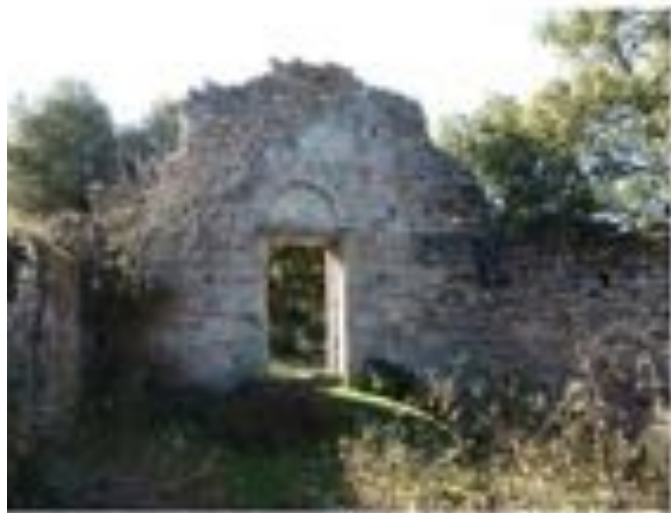
façade occidentale détruite

L'église en partie ruinée que l'on y voit paraît datable de la première moitié du XI e s. environ, et j'ai supposé qu'elle avait eu un rôle judiciaire particulier. En effet, son qualificatif de "Tribuna" permet de croire que l'on s'est souvenu longtemps du rôle d'édifice abritant des sessions de justice en alternance avec les offices religieux.