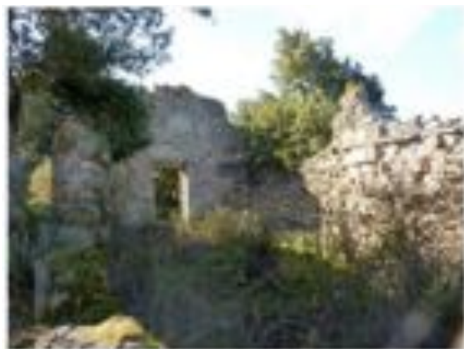
vue intérieure depuis l'abside: dans le mur sud s'ouvrait une porte latérale dont il ne reste plus rien.